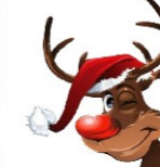
Et une bonne année