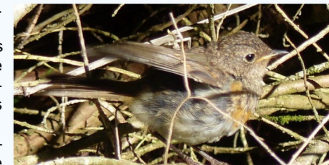
Ce jeune, dépourvu du plastron rouge des adultes, est né sous un épais fourré de genévriers, à Saint-Vincent.