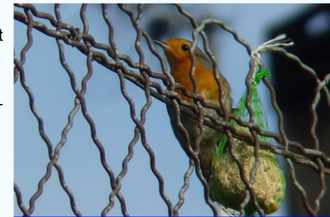
En hiver, il est attiré par la graisse et les graines.