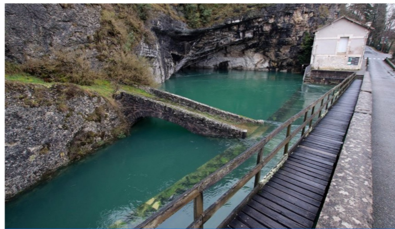
La Fontaine des Chartreux près du pont Valentré à Cahors.

Le point faible de la fontaine des Chartreux c'est la turbidité de l'eau qui se manifeste parfois les jours de forte pluie. Or l'État et l'ARS (Agence Régionale de Santé) imposent un système de traitement qui fait l'objet d'une étude. L'objectif étant d'éliminer cette turbidité sans toucher au goût de l'eau, le Grand Cahors vient d'adopter, en séance communautaire à Cieurac, le 10 novembre, deux dispositions. La première concerne l'installation d'un système de traitement par ultraviolet de l'eau issue de la Fontaine des Chartreux. La seconde concerne l'engagement dans un contrat de projet multipartite pour la réalisation de l'unité de filtration à la Fontaine des Chartreux.