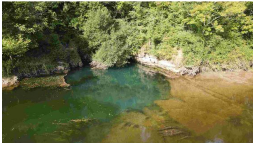
La résurgence de la source bleue à Soturac.

Captée à 20 mètres de profondeur l'eau est pompée vers l'unité de filtration. Elle est ensuite dirigée vers les réseaux de distribution pour desservir environ 11000 abonnés.