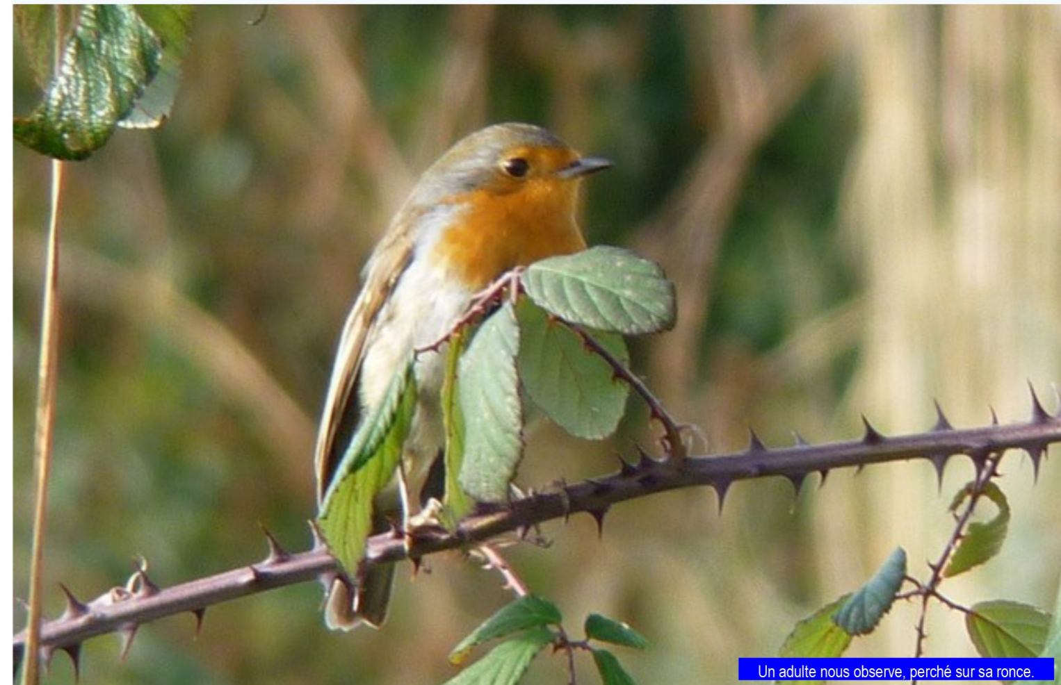
Un adulte nous observe, perché sur sa ronce.