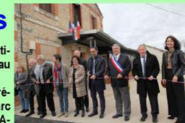
Le nouvel espace associatif est ouvert.

Le premier ruban coupé aux Roques était dédié à (dixit Mr le préfet) «quelque chose devenue invisible», en évoquant l'enfouissement des réseaux du village. L'ensemble des participants, préfet et maire en tête, ciseaux bien en main, ont entrepris une promenade champêtre de 600 mètres vers la remarquable gariotte des Roques, un édifice atypique et unique en son genre telle une pyramide aztèque, érigé dans un cadre bucolique et apaisant. Acquis en 2015 par la municipalité et admirablement rénovée par l'entreprise RESSEJAC, la gariotte des Roques est élevée au bord des gorges de Landorre, et mérite vraiment le détour. De superbes tables de picnic sont installées sur le site. Un deuxième coup de ciseaux du préfet et le cortège s'est rendu à Cournou pour l'ouverture solennelle de l'espace associatif, une salle superbe dotée d'un bel équipement fonctionnel et d'un grand écran panoramique sur les vignes. C'est là que les personnalités se sont protocolairement succédées au pupitre. Tous les convives se sont ensuite, amicalement retrouvés autour d'un superbe buffet concocté par la Poêle gourmande de Luzech. Le soir, un repas partagé autour de l'incontournable tourin a conclu cette belle journée bien remplie.