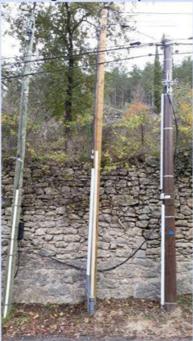
Les poteaux qui cachent la forêt.

...Sauf que l'installation du câble optique sur les poteaux d'Orange dans la traverse de Cournou s'avère impossible en raison du résultat des calculs de charge. (Cela le deviendra dès que Orange aura changé les supports défectueux, mais quinze jours trop tard). Lot numérique s'investit fortement dans cette problématique et plusieurs réunions de terrain sont organisées pour essayer de trouver la meilleure solution. Il apparaît rapidement (mais plusieurs rencontres explicatives sont nécessaires!) qu'il y a tout intérêt à créer un réseau autonome et indépendant pour contourner le bourg de Cournou. Ce qui est réalisé par Lot numérique durant l'année 2019, avec quelques complications opérationnelles. Enfin l'augmentation de puissance d'Internet sur le village des Roques sera opérationnelle à Noël. Parallèlement, Lot numérique a eu l'opportunité de signer un contrat de délégation de service public dans des conditions très favorables pour raccorder à la fibre tous les foyers et entreprises du Lot d'ici 2022 (plus de 100 mb disponibles). D'où la mise en place d'une nouvelle fibre en utilisant l'ensemble des supports existants (heureusement que Orange a changé les supports défectueux) pour une desserte complète des abonnés de Cournou et des Roques qui le désirent dans les prochains mois.