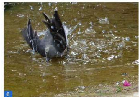
Jeune Bergeronnette grise se baignant dans le Bondoire.