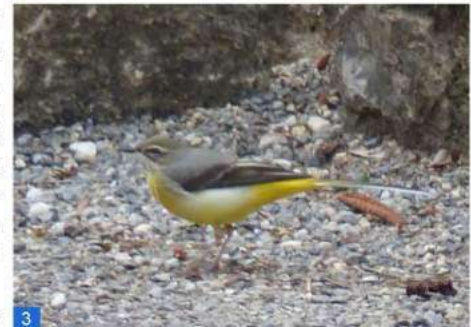
Bergeronnette des ruisseaux femelle, avec des fibres dans le bec pour garnir son nid, au pied du mur du moulin du Pesquié.