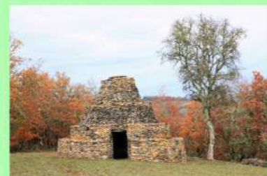
La Gariotte des Roques.