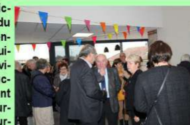
Ambiance chaleureuse autour du buffet.