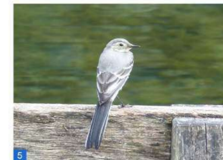
Jeune Bergeronnette grise.