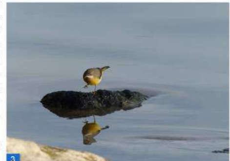
Bergeronnette des ruisseaux, plumage d'hiver, et son reflet dans l'eau.