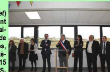
Mr le maire a ouvert la tribune.