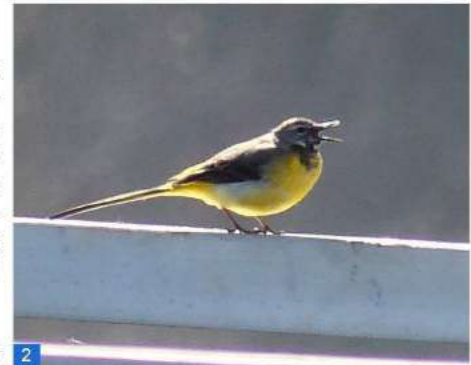
Bergeronnette des ruisseaux. Un mâle qui chante.