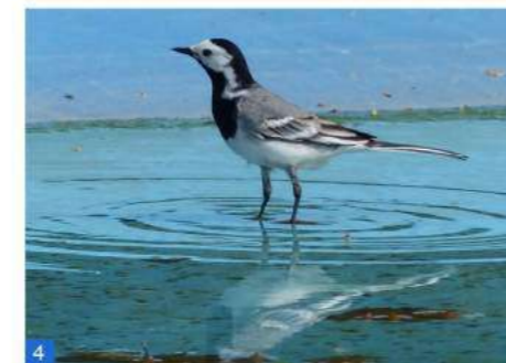
Bergeronnette grise, mâle adulte.