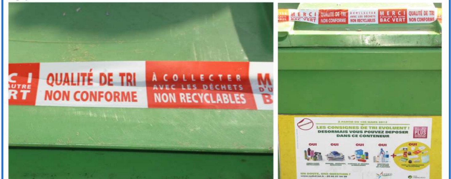
Exemple consternant ! Le contenu de ce bac ne pourra être recyclé, pollué par des déchets ménagers qui ont été inconsidérément déversés. Soyons responsables et clairvoyants et non coupables et bornés.

Alors, s'il s'agit simplement de soulever le bon couvercle du bon conteneur. Ensemble, respectons la simple logique des demandes du SYDED.