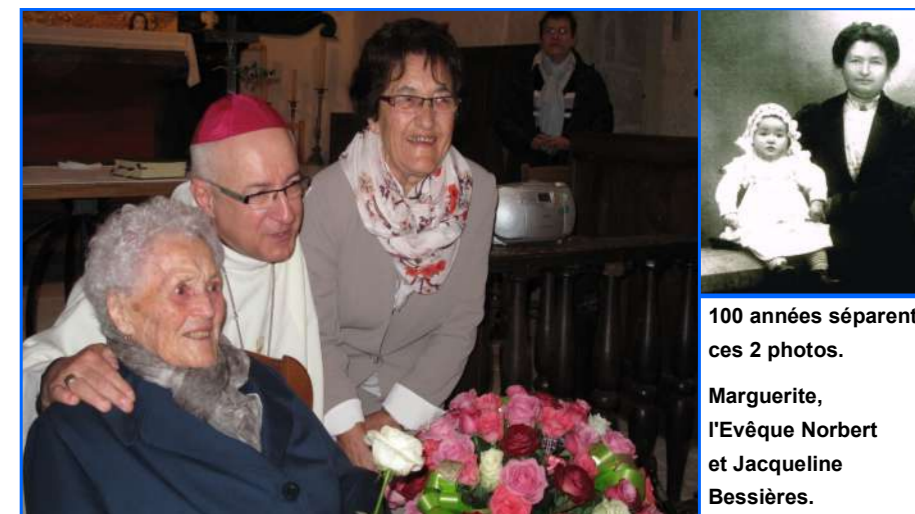
100 années séparent ces 2 photos.

- Carnet. - Avant et maintenant. - Mairie. - Pot des élus